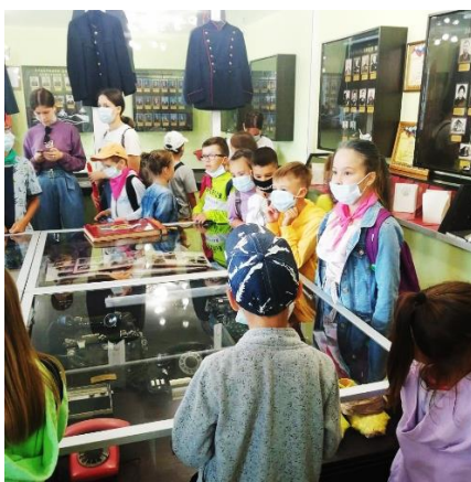
В Музее ветеранов МВД