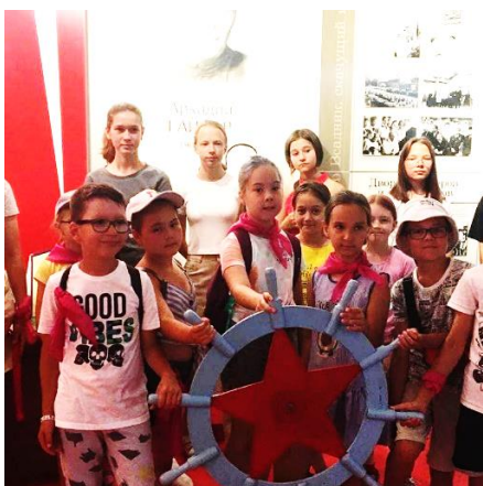
В Музее А.П. Гайдара