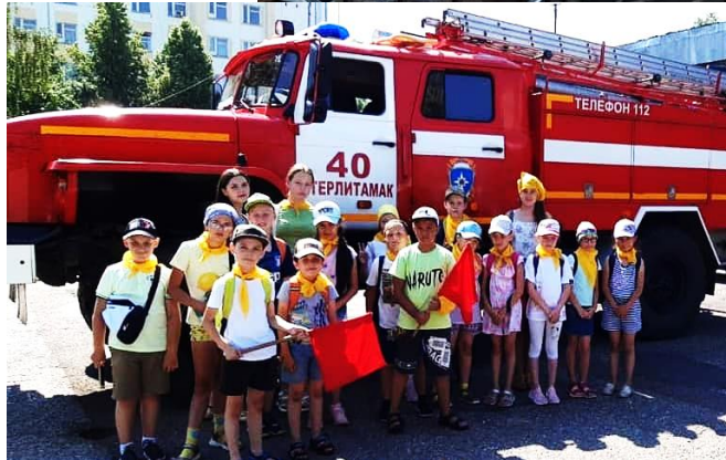
В городской пожарной части