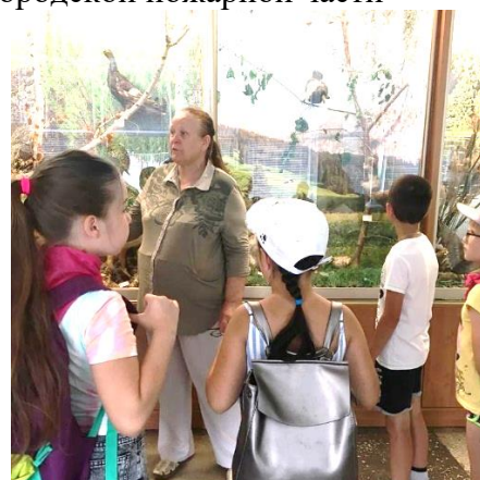
В живом уголке Дворца пионеров